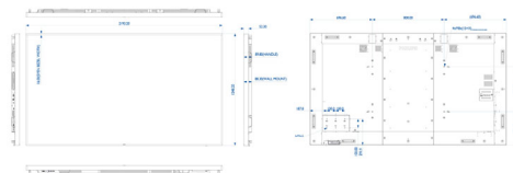
Philips 98BDL4150D Version 2.2.2