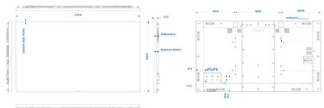
Philips 98BDL4150D www.philips.com