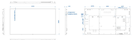
Philips 86BDL4150D www.philips.com