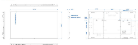
Philips 86BDL4150D Hozzájárul a környezetvédelemhez