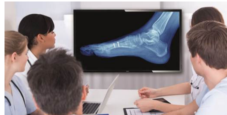
Imagem D clínica

A imagem D ajuda-o a analisar e diagnosticar imagens clínicas com um desempenho de visualização consistente e preciso. Para obter interpretações clínicas fiáveis, os nossos ecrãs profissionais são calibrados de fábrica para oferecer um desempenho de visualização padrão otimizado da escala de cinzentos. A imagem D ajuda-o para alcançar um nível de excelência em todos os aspectos dos cuidados de pacientes.